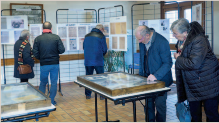
L'exposition vue par 320 visiteurs dont les classes CE1, CE2, CM1 et CM2 du Groupe Scolaire