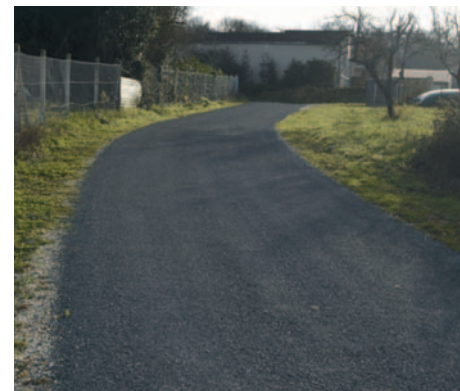
Réfection de la route du Chêne à Chez Bouyer et aménagement de caniveaux d'eaux pluviales.