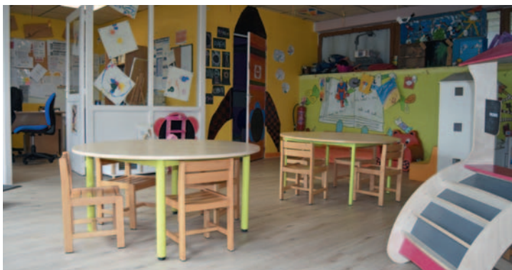
La construction d'un espace direction et animatrices et la réfection du sol de la garderie des K'gouilles en attendant la refonte complète du bâtiment.