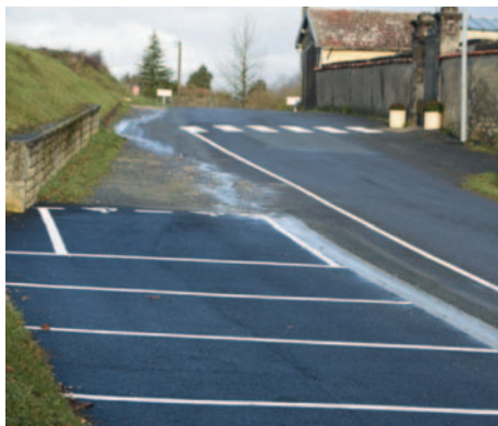
Goudronnage du parking du cimetière et création d'un passage piéton.

L'amélioration de la voirie se poursuit dans notre commune au rythme de nos capacités de financement.