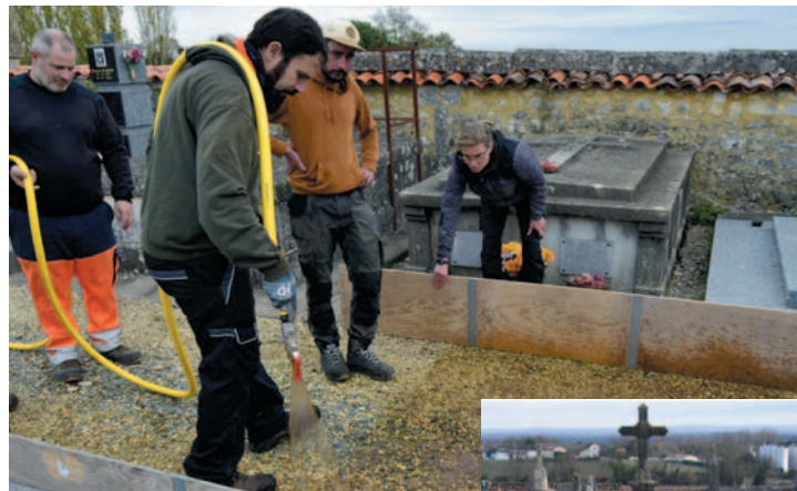
Projection du mulch dans les allées

Quelques jours plus tard la levée est bien avancée