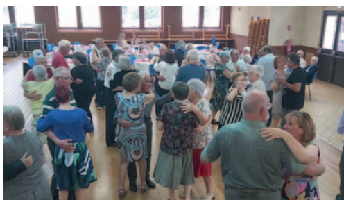
Les danseurs en mai

Le premier, le 12 mai décalé de plusieurs mois à cause des restrictions Covid et le deuxième le 16 décembre à la veille des fêtes de Noël .