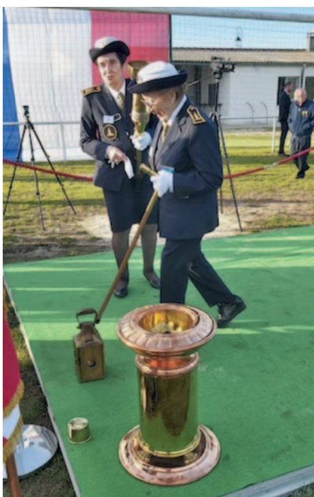
La Secrétaire d'état aux anciens combattants Mme Patricia Mirales ravivant la flamme aux Gonds.

La commémoration de la fin de la première guerre mondiale a été marquée cette année par la visite le 7 novembre de la Secrétaire d'état aux anciens combattants Mme Patricia Mirales sur la commune des Gonds venue porter la flamme du soldat inconnu.