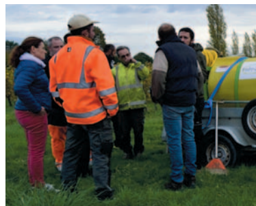
Formation des agents techniques municipaux par la société Hydroland

Parmi celles-ci l'hydroseeding (comprenez l'ensemencement à l'eau) offre l'avantage de ne nécessiter aucune préparation du sol au préalable. A l'aide d'un équipement spécial on projette sous pression d'eau un mélange de : graines de graminées (ray-grass et fétuque rouge), fibres de bois (le mulch), amendement et colle. Une fois projeté au sol, le mulch qui enrobe les graines, maintient l'humidité le temps nécessaire à une bonne levée. L'entretien s'effectue ensuite simplement par des tontes régulières.