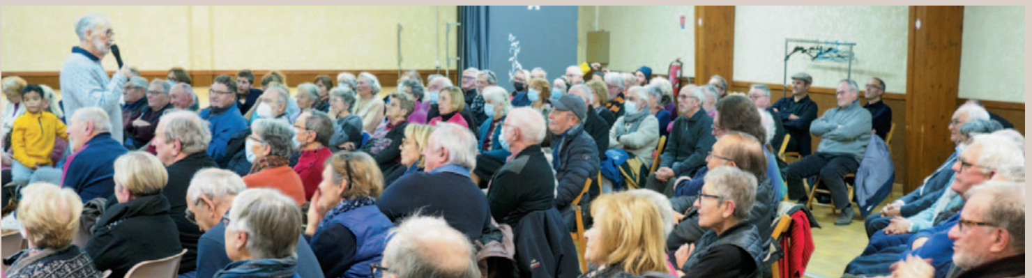
Les spectateurs attentifs à la richesse de la vie de Goulebenéze contée par Maït' Piârre.