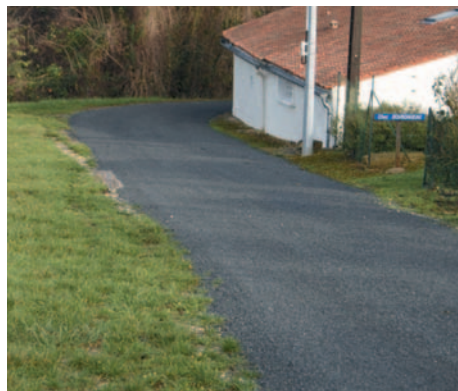
Réfection de la chaussée traversant Chez Bourdageau.