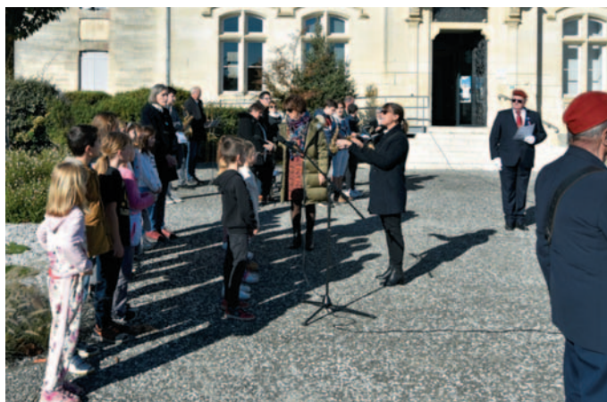
La cérémonie a été clôturée par les élèves de l'Ecole Primaire chantant la Marseillaise et les musiciens de l'ADMS.

Cette flamme a été ensuite déployée dans plusieurs communes de Charente Maritime dont Burie où elle a été ravivée lors de la cérémonie du 11 novembre.