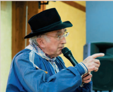
Châgnut contant une histouère de Goulebenéze.