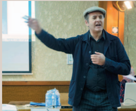
Le Fi à Feurnand chantant Goulebenéze a capela.