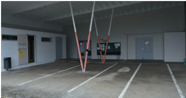
La réfection de la peinture du préau du Groupe Scolaire.

Au-delà des incontournables travaux d'entretien de toiture (Ecole, Logements communaux), quelques importants travaux d'amélioration ont été réalisés, citons :