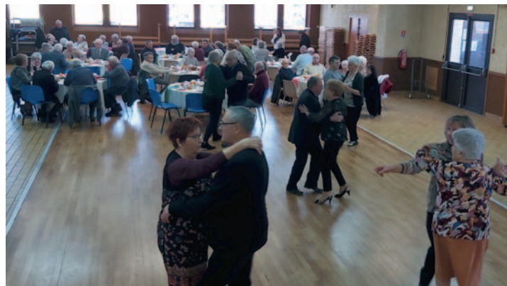
Le thé dansant de décembre

Entre 50 et 60 aînés ont pu retrouver leurs réflexes de valseurs le temps d'un après-midi à ces deux occasions.