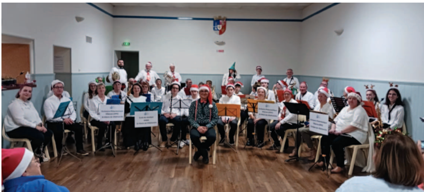
Concert de Noël de l'Orchestre à Vénérand decembre 2024