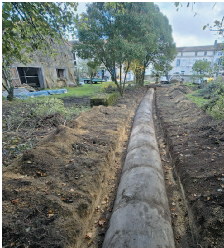
Dégagement pour réparation du busage sur terrain privé Aldo Gimon.