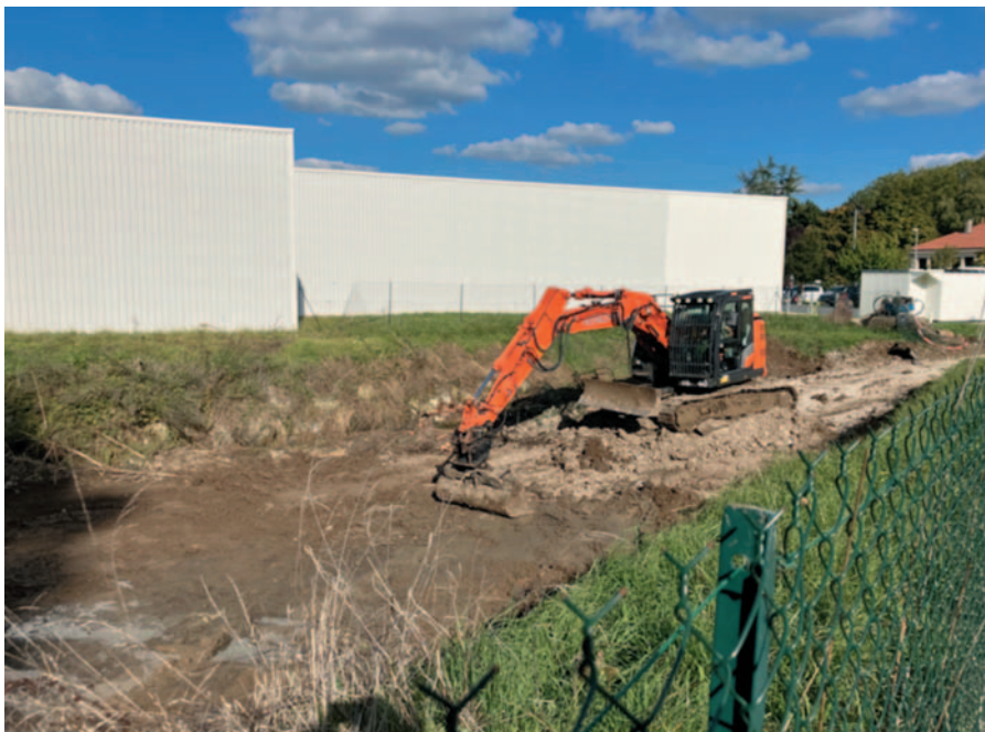
Curage du bassin d'orage de Carrefour.