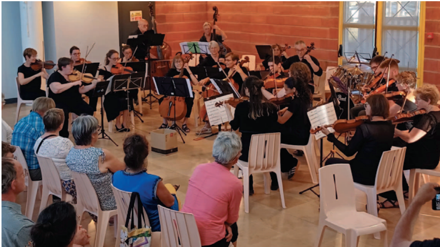
Classe de cordes à Nantillé juin 2025

Le 15 mai, concert d'un orchestre d'harmonie de professionnels à la salle Jean Garnier de Saint-Hilaire-de-Villefranche à 20 heures 30, le lendemain 16 mai, à partir de 14 heures, ce sera autour des grandes formations actuelles de l'ADMS et nous terminerons avec un orchestre d'harmonie d'anciens élèves.